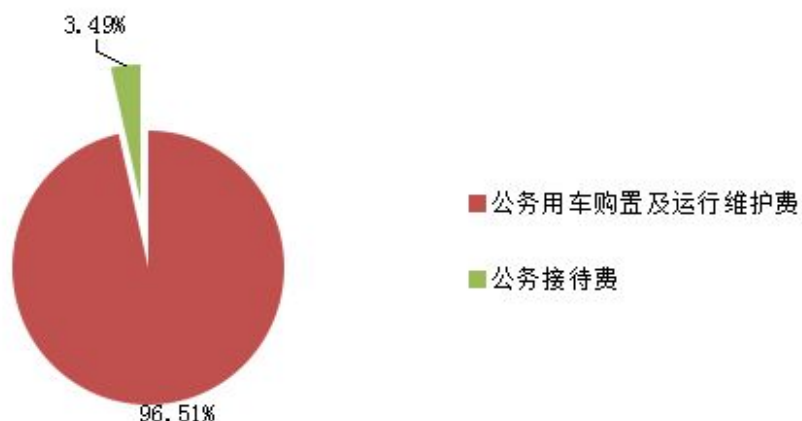
中国人民银行珠海市分行 2024 年度 “三公”经费支出构成

2024 年度“三公”经费决算数 40.42 万元，包括公务用车购置及运行维护费 39.01 万元，占 96.51%；公务接待费 1.41 万元，占 3.49%。具体情况如下：